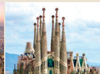
Bazylika Sagrada Familia, Barcelona