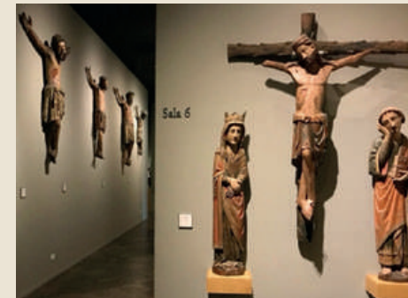
Sala z krucyfikami, Muzeum Marés

28 sierpnia 1962 roku musiała opuścić klasztor, ponieważ nie została dopuszczona do ślubów wieczystych. Dwa miesiące później zamieszkała