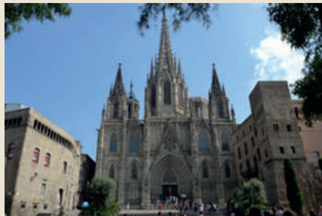
Katedra w Barcelonie