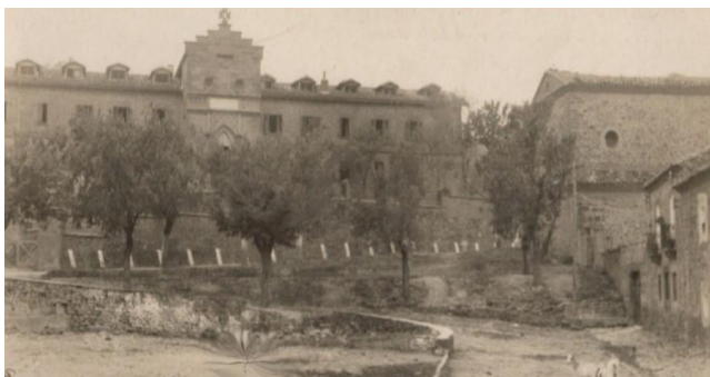
Casa del noviziato delle missionarie. Attuale parcheggio di fronte al castello.