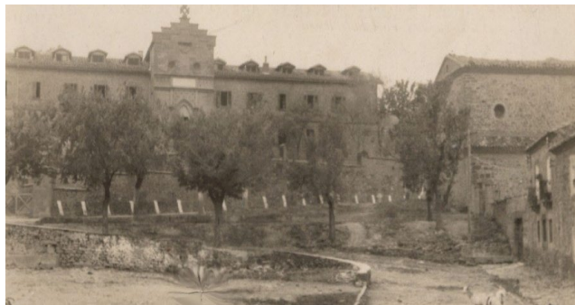
Maison du noviciat des religieuses missionnaires. Parking actuel devant le château.