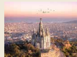
Vista de Barcelona, desde el Tibidabo