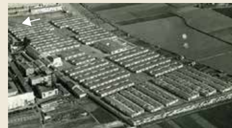
Casas baratas “Eduardo Aunós”, en el barrio de Casa Antúnez. La fecha blanca señala la vivienda de Carmen en la calle Tragura, 21.

El 28 de agosto de 1962 debe salir del convento al no ser admitida a los votos temporales. Dos meses más tarde irá a vivir a dos barrios muy humildes de Barcelona: la Trinidad Nueva y las Casas Baratas “Eduardo Aunós” (calle Tragura), junto a Montjuic (actualmente derruido). Durante ese tiempo trabajará en varias fábricas de la ciudad.