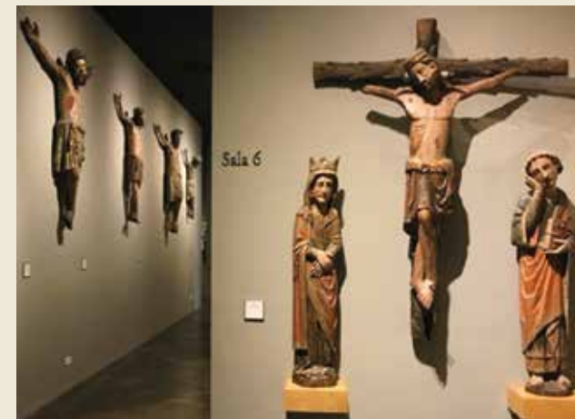
Sala de los Crucifijos, Museo Marés

El 28 de agosto de 1962 debe salir del convento al no ser admitida a los votos temporales. Dos meses más tarde irá a vivir a dos barrios muy humildes de Barcelona: la Trinidad Nueva y las Casas Baratas “Eduardo Aunós” (calle Tragura), junto a Montjuic (actualmente derruido). Durante ese tiempo trabajará en varias fábricas de la ciudad.