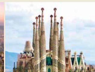
Basílica de la Sagrada Família, Barcelona