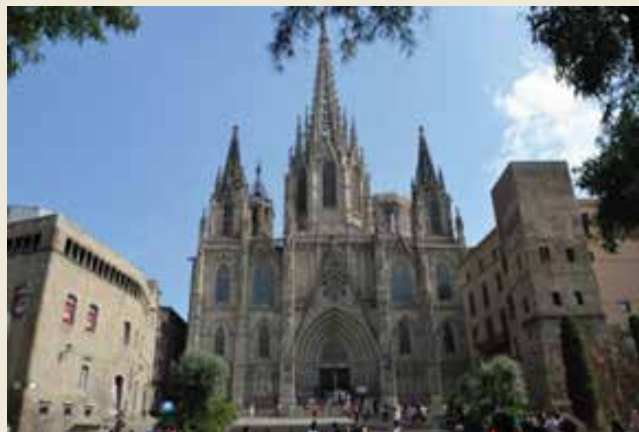
Catedral de Barcelona