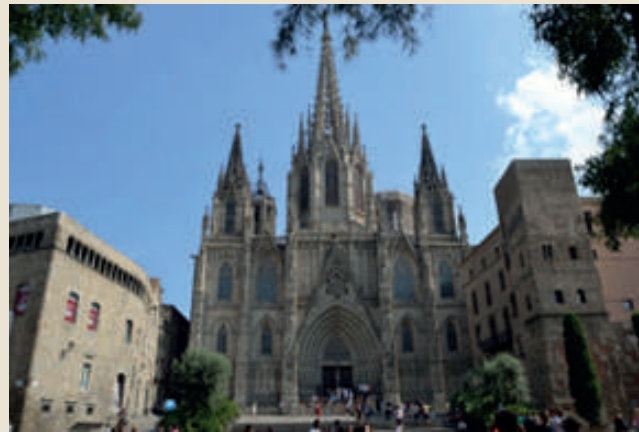
Catedral de Barcelona