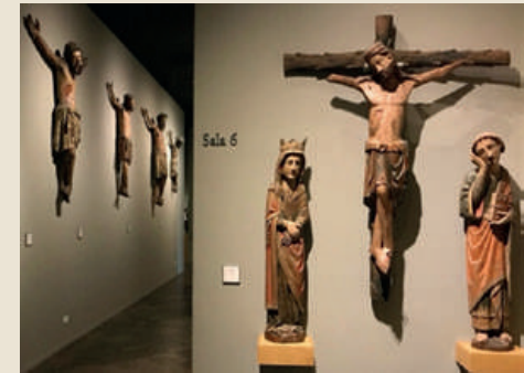
Sala de los Crucifijos, Museo Marés

dos barrios muy humildes de Barcelona: la Trinidad Nueva y las Casas Baratas “Eduardo Aunós” (calle Tragura), junto a Montjuic (actualmente derruido). Durante ese tiempo trabajará en varias fábricas de la ciudad.