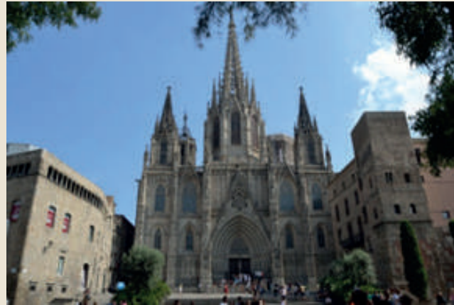
Cattedrale di Barcellona