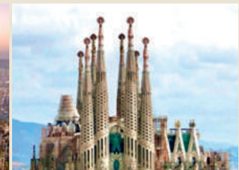
Basilica della Sacra Famiglia, Barcellona