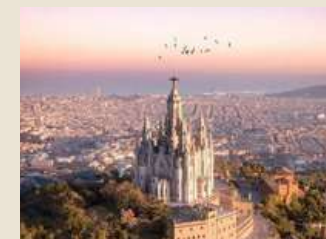
Vista de Barcelona, desde el Tibidabo