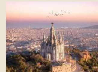
Barcellona, vista dal Tibidabo