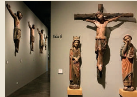
Sala dei Crocifissi, Museo Marés